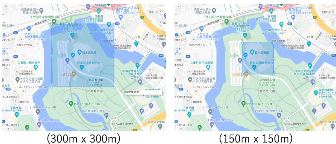
図2 ジオフェンスゾーンのサイズ比較

なお、登録可能数は1つのデバイス毎に最大5箇所です。図2に示す通り、これまでの300m四方だと日本武道館及びその周辺だったが、150m四方だとほぼ日本武道館を囲む大きさとなります。