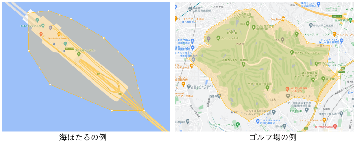
図3 ポリゴンゾーンの事例

新規に追加されたサーバー型のジオフェンスです。新たに多角形のゾーンを設定することが可能となりました。例えば、東京湾アクアラインのパーキングエリア「海ほたる」を囲った例や、ゴルフ場を囲った例を図3に示します。複雑な地形でも自由自在に囲むことが可能となりました。サーバーで処理しているので、登録数の制限がありません。また、GPS 端末のバッテリーを消費しないのも特徴です。