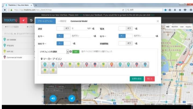
トラッキモ GPS・各種機能設定画面