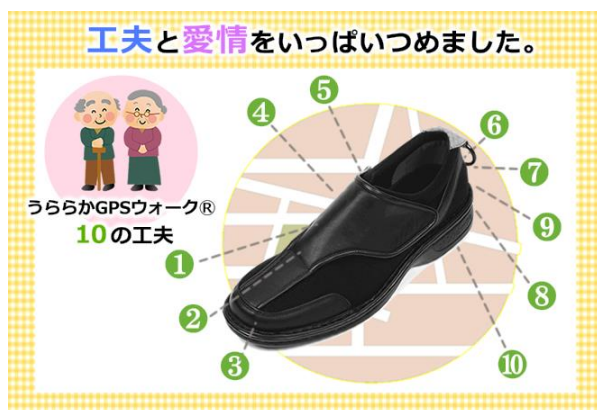
うららか GPS ウォーク®

トレイルは介護シューズ専門メーカーとして、機能性と洗練されたデザインを両立させた介護シューズを製造・販売し、介護市場に於いて高い評価を得ております。また以前から GPS 端末の介護分野への導入に積極的に取り組み、シューズの踵部分へ GPS 端末を組み込んだ介護シューズ(うららか GPS ウォーク®)を開発し、全国の自治体等で採用され、その効果は厚労省の資料等でも紹介されるなど、実績と経験を重ねて来ました。