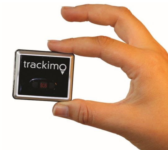
トラッキモ GPS 端末(Universal モデル)