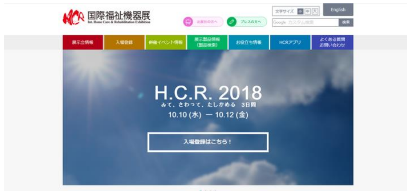
2018年10月10～12日・国際医療福祉機器展(HCR)